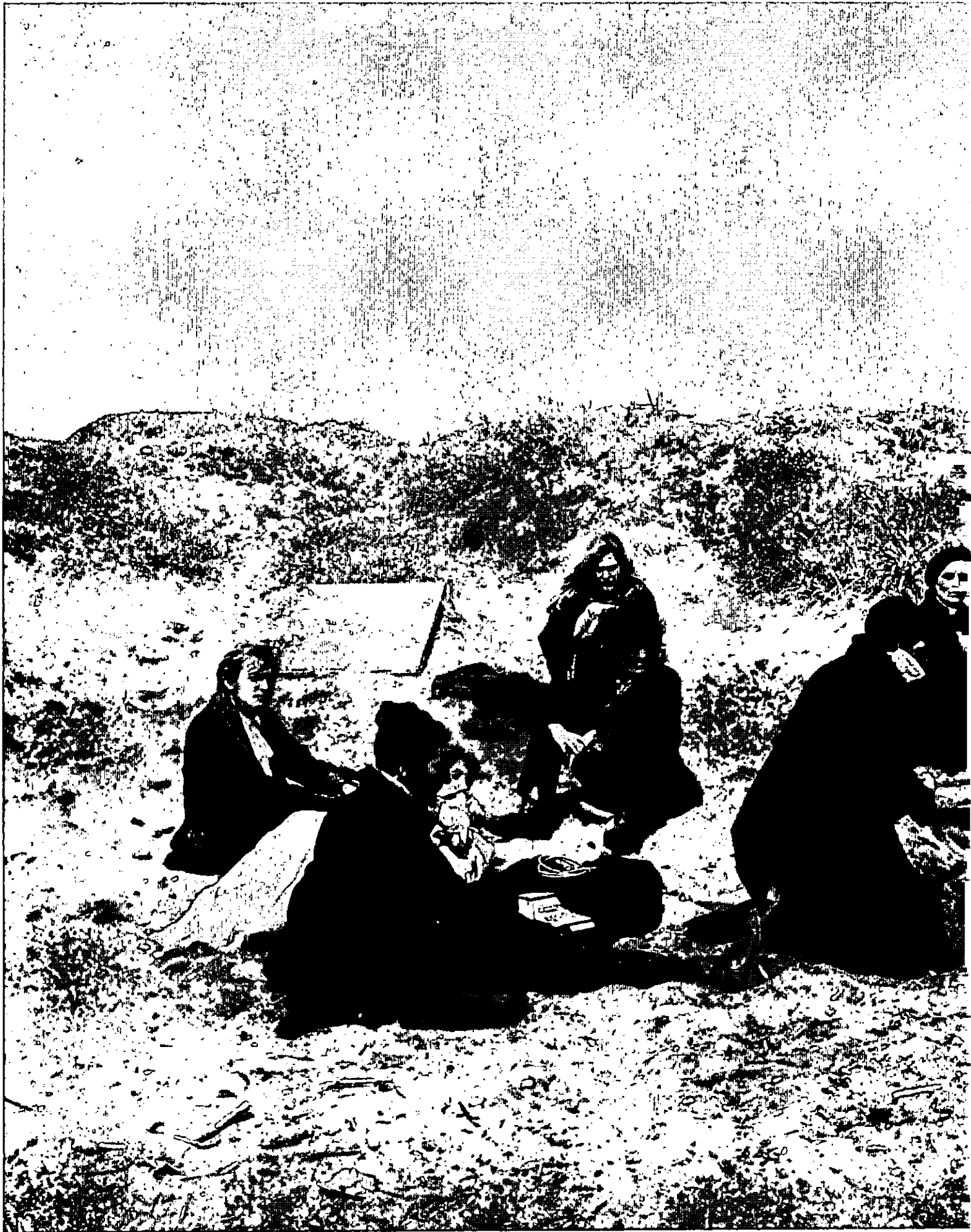
MARCO FERRERI : « IL SEME DELL' UOMO ».